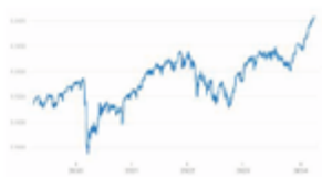
Euro Stoxx 50